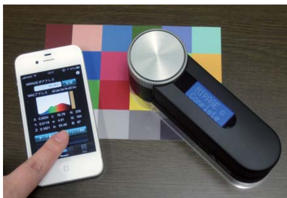
■ iPhone アプリケーションから測定・表示