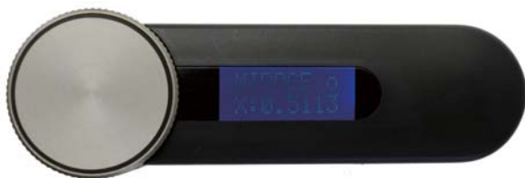
ボタンを押すと測定、ダイヤルを回すと表示の簡単操作！